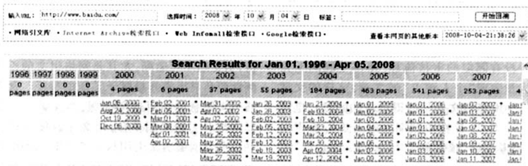
图 3 网络引文检索平台的 Internet Archive 接口实现

网络引文检索平台为读者提供了追溯特定时间和特定网址下网络引文的途径:系统将首先通过动态构建 SQL 语句,实现在网络引文库中的数据库检索,若未匹配到合适的网络引文,则调用 Internet Archive 和 Google 的检索接口,寻找合适的网络引文信息。关于 Google、Internet Archive 和 Web Infomall 等检索接口的实现,可以参见文献[30]。该平台的界面如图 3 所示,用户可以通过提交 URL 和 URL 存储的时间来追溯网络引文,亦可以通过提交网页相关的描述信息,匹配数据库和各个接口的网页信息。通过点击各个选项卡,就可以切换到不同的接口下查看相关信息,用户还可以点击时间下拉菜单查看存储的不同版本的网络引文。